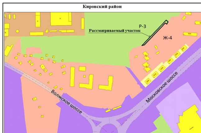
Рисунок 3. 18-й км микрорайон, Московское шоссе 18 километр в Кировском районе. Изменение части зоны Р-3 (площадью 723 кв. м) на зону Ж-4