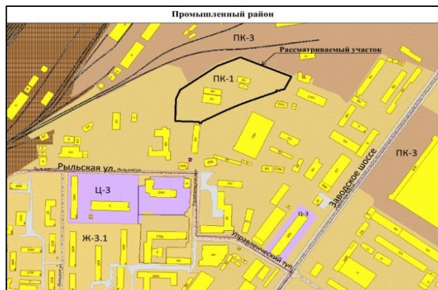
Рисунок 1. Управленческий тупик, 7 с кадастровым номером 63:01:0925007:540 в Промышленном районе. Изменение части зоны ПК-1 (площадью 17896,4 кв. м) на зону ПК-3