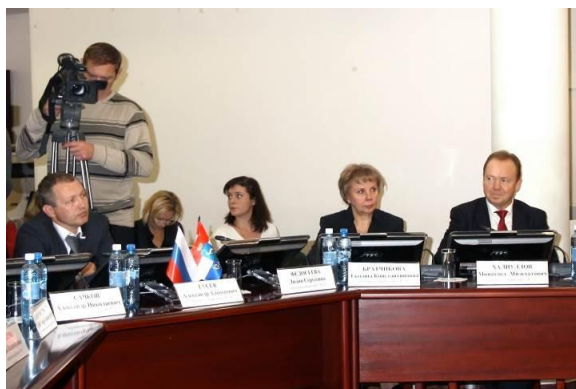
№269 О награждении Почетной грамотой Думы городского округа Самара