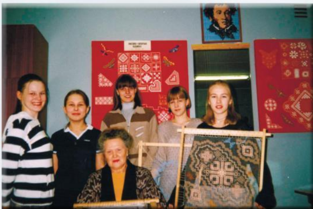
Кружок «Филейно-гипюрная вышивка»