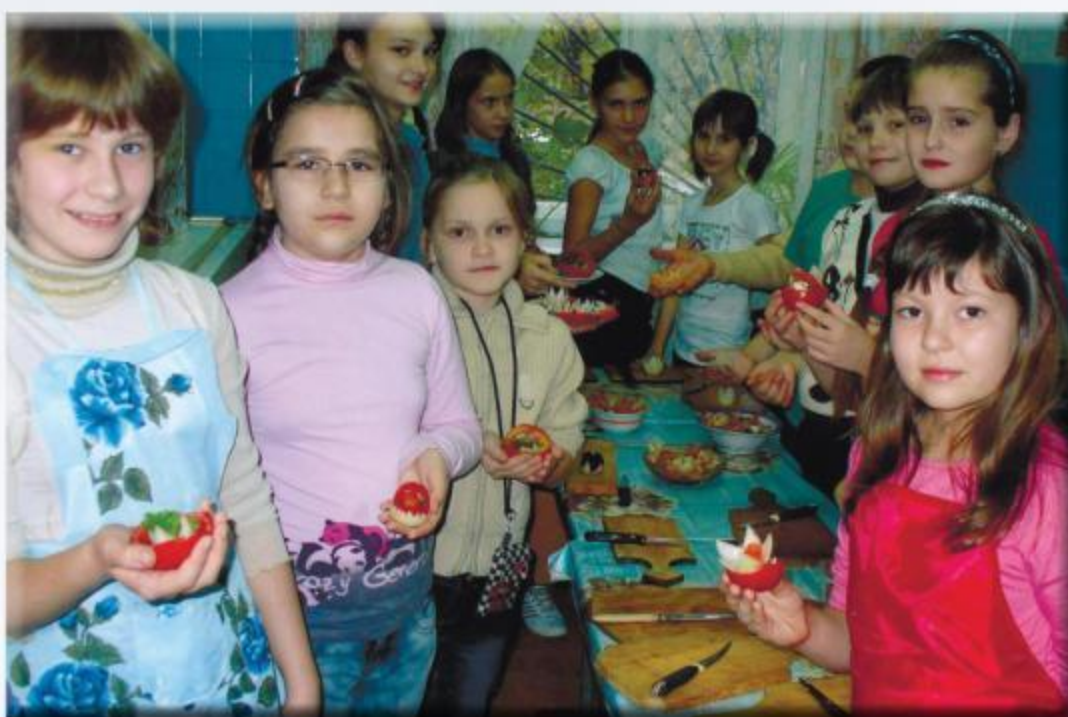
Кружок «Юная хозяйюшка»