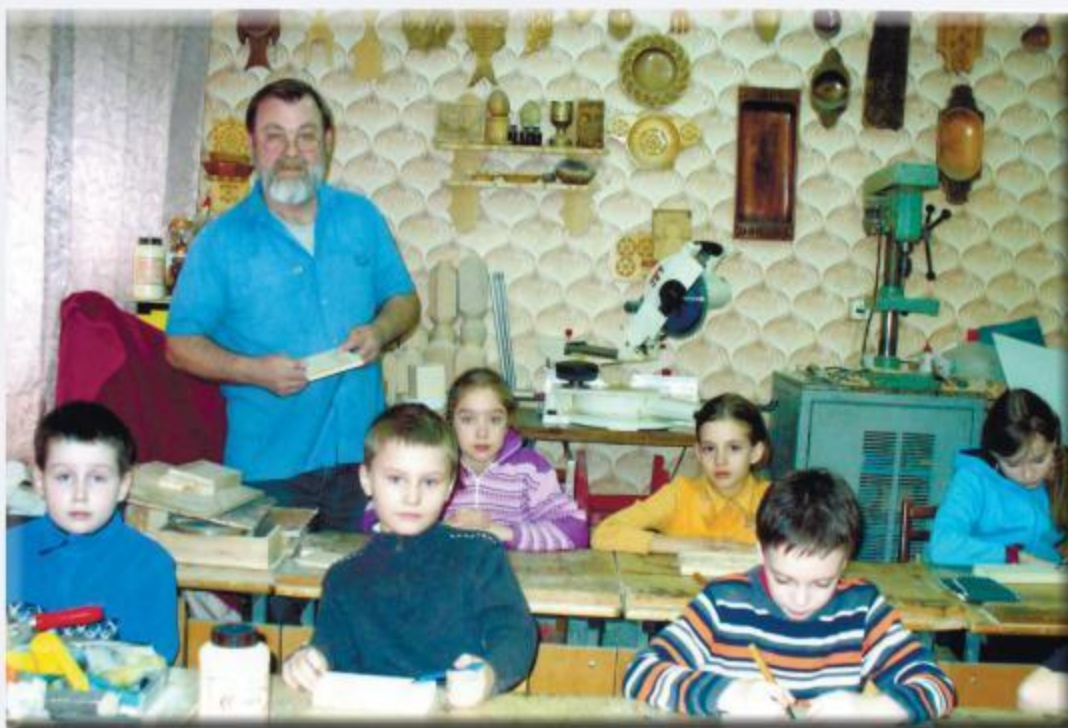
Кружок «Резьба по дереву»