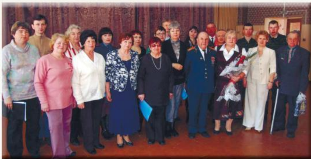
Почетные гости Музея боевой славы школы №146 пос.Прибрежный