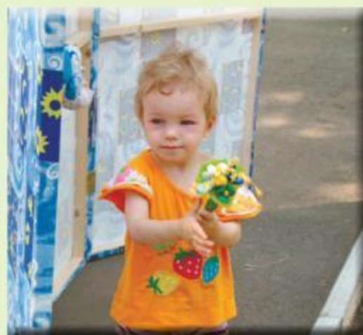
Кукольный театр в Доме ребенка «Малютка»