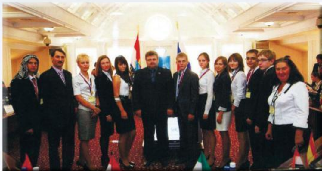
Модель ООН в Самаре. Встреча в Думе г.о. Самара