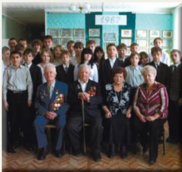
Урок Мужества в 7 классе школы №146 пос.Прибрежный

другими школьниками. На Всероссийском смотре-конкурсе музеев Боевой славы, проходившем в Москве, завоевал Диплом под №1. Ребята – экскурсоводы музея – на зубок знают весь боевой путь земляков – участников ВОВ, и активно делятся своими знаниями с другими школьниками.