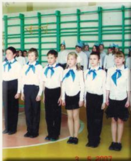
Конкурс строевой песни. Школа №165