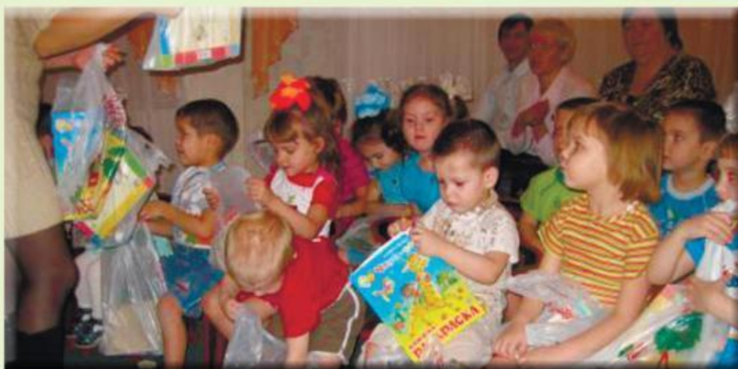
Областной центр усыновления, опеки и попечительства