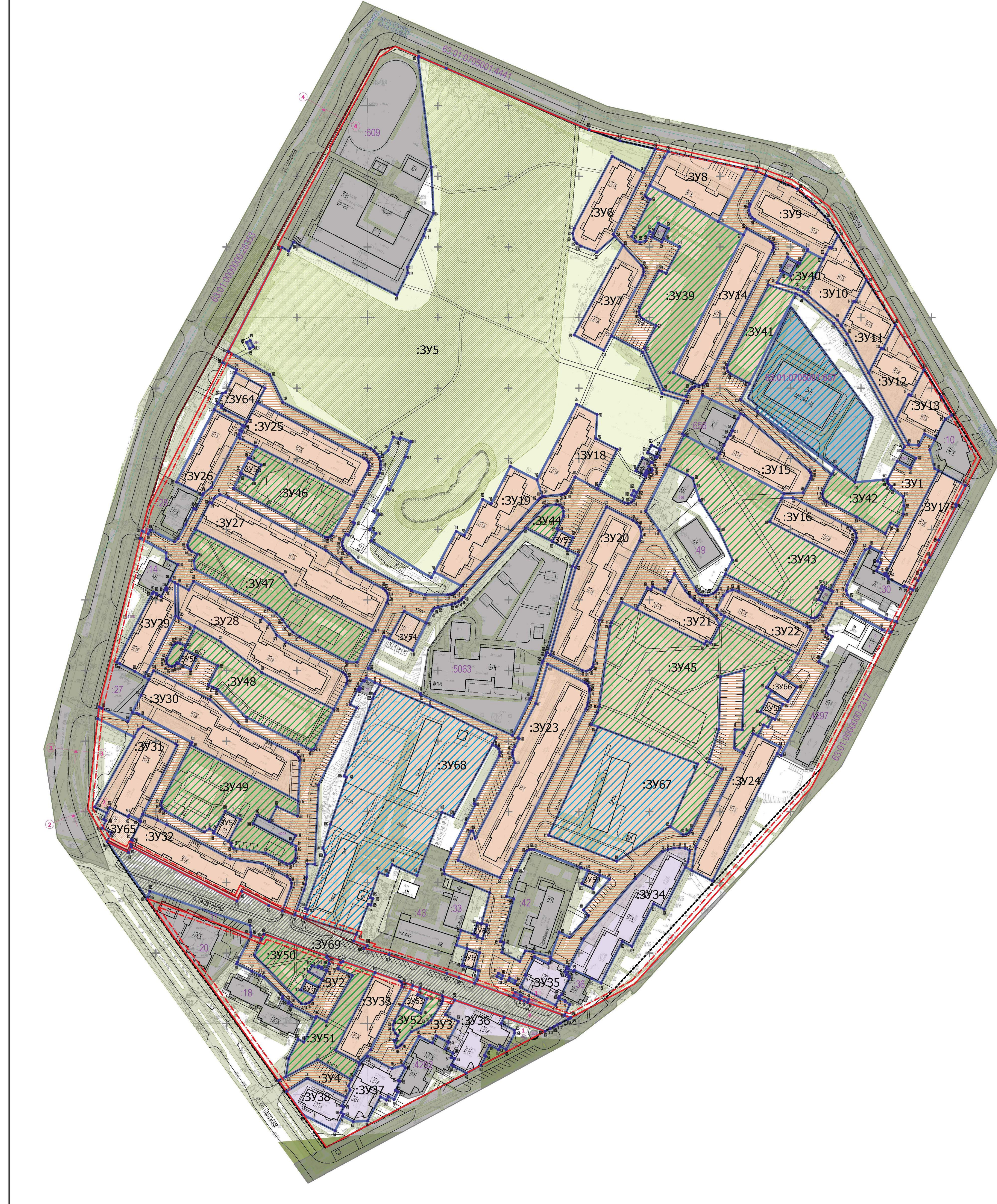
Каталог координат переломных точек образующих земельных участков (координаты математические, местная система координат городского округа Самара)