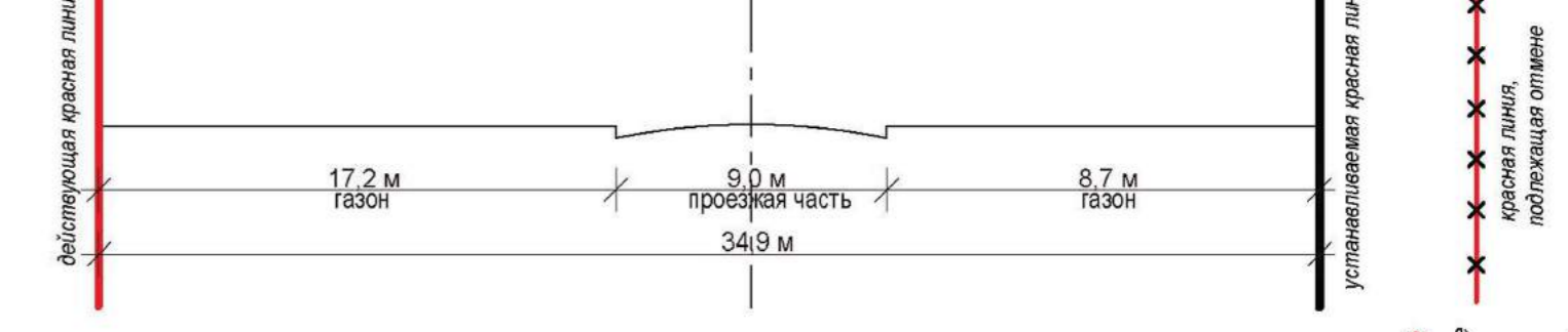
Сечение 3 - 3 (ул. Солнечная)