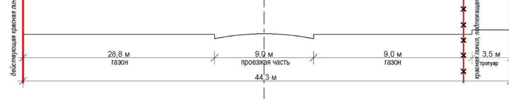
Сечение 4 - 4 (ул. Солнечная)