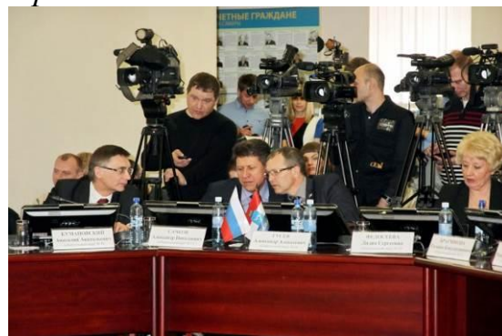
№319 О награждении Почетной грамотой Думы городского округа Самара