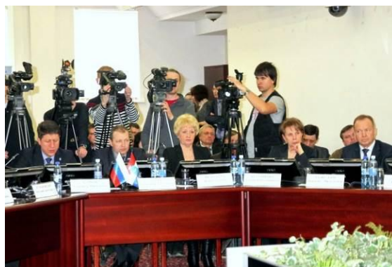
№316 О внесении изменений в Правила застройки и землепользования в городе Самаре, утвержденные Постановлением Самарской городской Думы от 26 апреля 2001 года №61