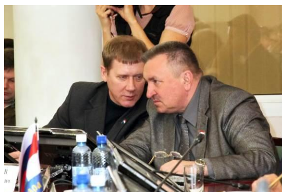
№317 О внесении изменения в Решение Думы городского округа Самара от 25 февраля 2010 года №852 «Об утверждении Положения «О порядке предоставления земельных участков, находящихся в муниципальной собственности городского округа Самара, для целей, не связанных со строительством»