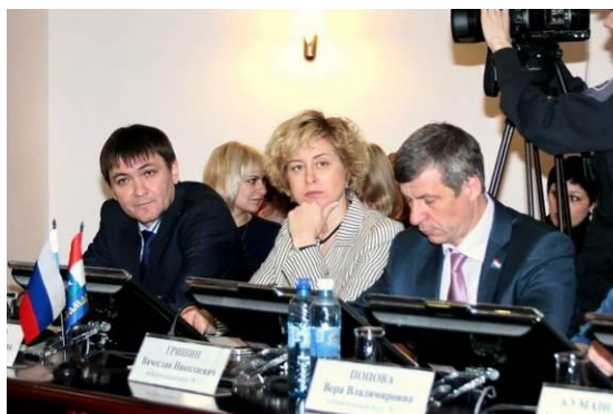
№318 О внесении изменений в отдельные правовые акты