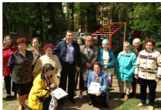
ул. Урицкого, д. №20, №22

Совместно с председателями МКД депутат определил места установки малых архитектурных форм на территории избирательного округа №1 и их содержание.