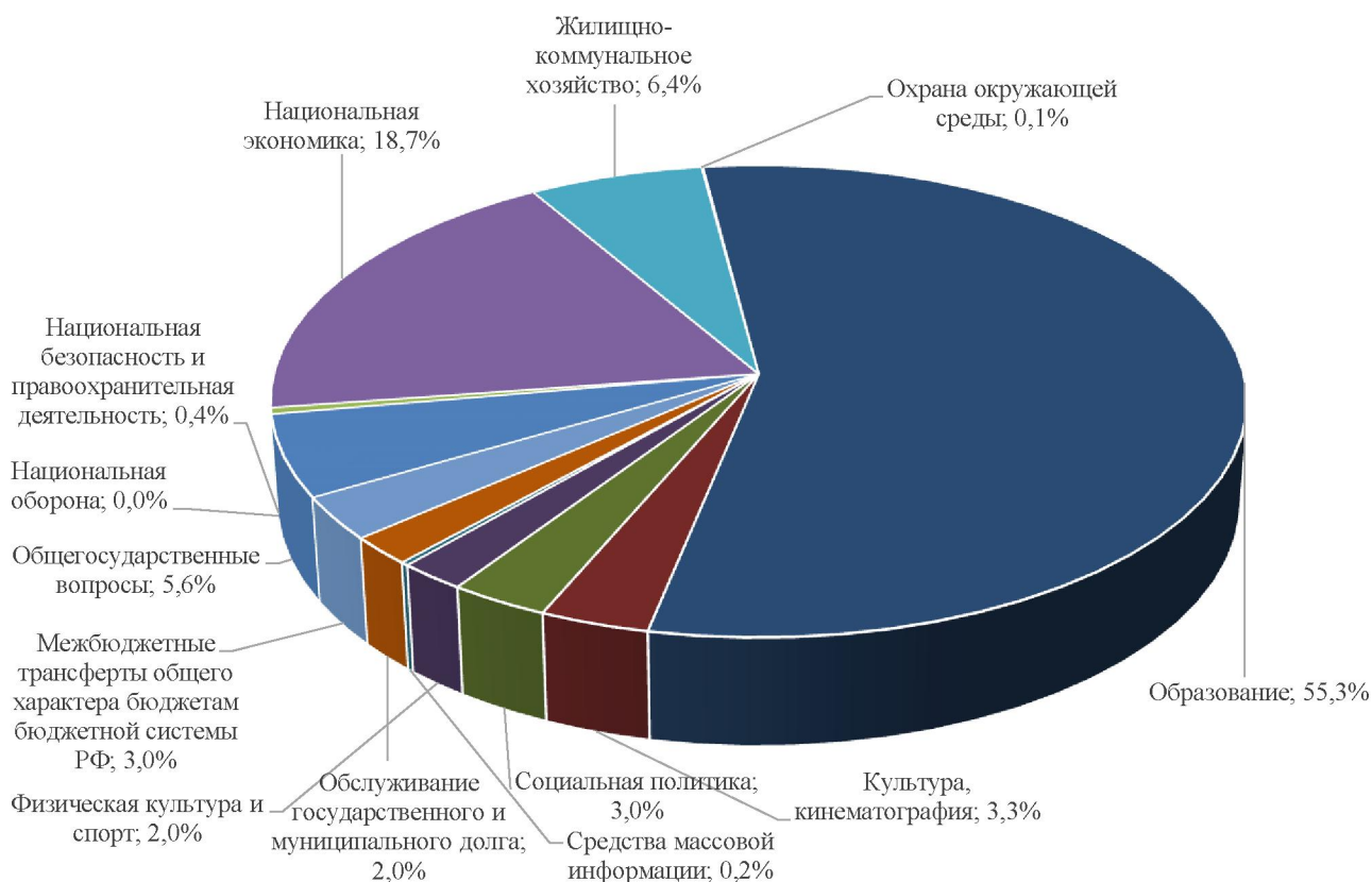
Рис.2. Структура исполнения расходов по отраслям по состоянию на 01.07.2019

2.3. В целом исполнение бюджета г.о. Самара по расходам по состоянию на 01.07.2019 составило 12081838,6 тыс. руб. или 43,2% относительно плановых показателей, утвержденных бюджетом на 2019 год.