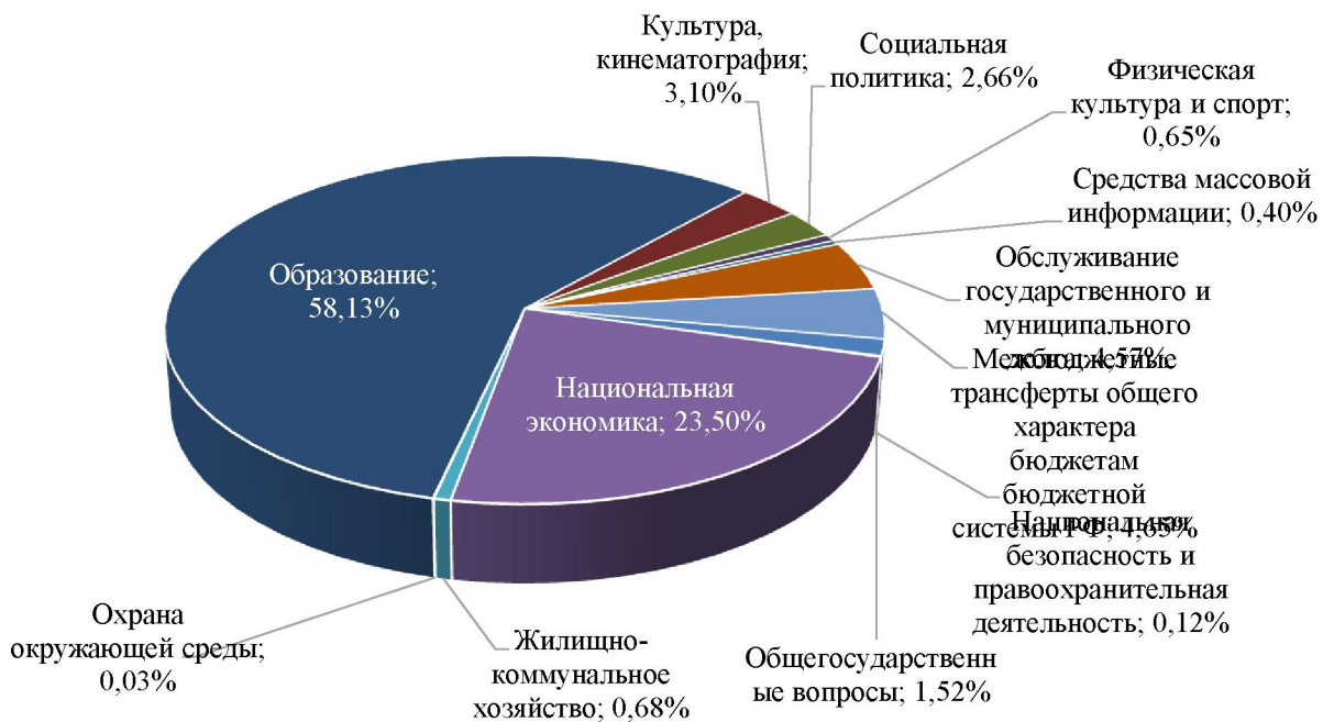
Рис.2. Структура исполнения расходов по разделам по состоянию на 01.02.2018

2.2. Из Рис.2. видно, что в структуре исполнения расходов наибольший удельный вес занимают разделы « Образование » - 58,13%, « Национальная экономика » - 23,5%, « Межбюджетные трансферты общего характера бюджетам бюджетной системы РФ » - 4,65%, « Обслуживание государственного и муниципального долга » - 4,57%.