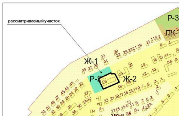
Рисунок 2. Ул. Охтинская, д. 25, с кадастровым номером 63:17:0702001:657 в Куйбышевском районе Изменение части зоны Р-2 (площадью 2,5 кв. м) на зону Ж-2