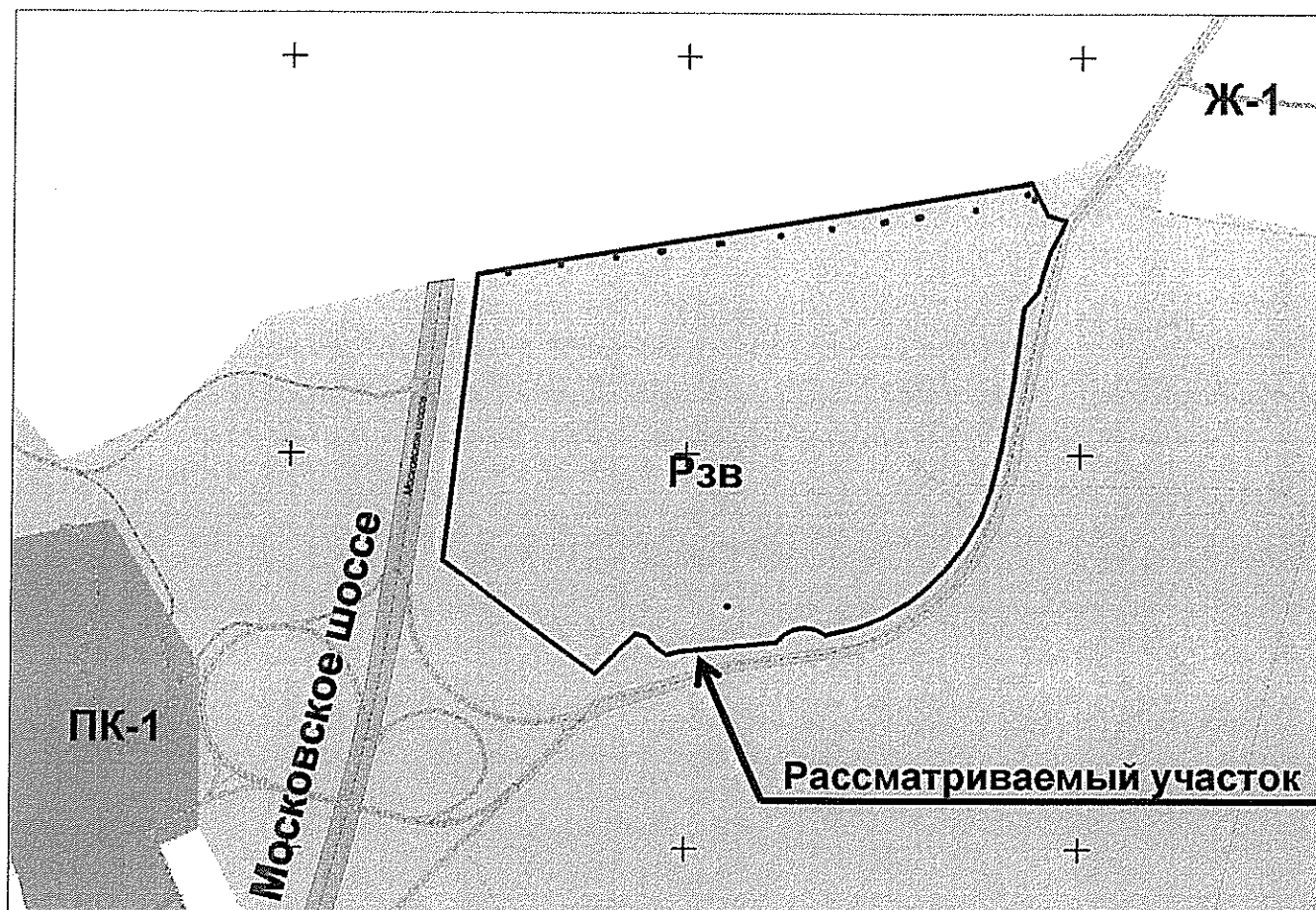
Рисунок 20. В районе 24-го км Московского шоссе в Красноглинском районе Изменение части зоны РЗВ (площадью 346800 кв. м) на зону Ц-2