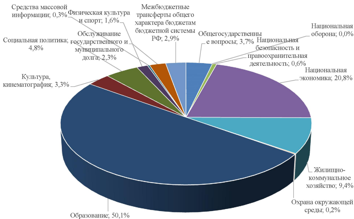
Рис.2. Структура исполнения расходов по отраслям по состоянию на 01.11.2018

2.3. В целом исполнение бюджета г.о. Самара по расходам по состоянию на 01.11.2018 составило 19896547,0 тыс. руб. или 75,2% относительно плановых показателей.